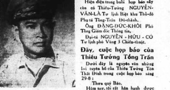
Thiếu tướng TÔN-THẤT-ĐÌNH

SÀI-GON.— Vào hồi 10 giờ sáng hôm nay (28-8) tại Tòa Đô-Thanh, Thủ Tướng Tô-thất-Đình, Thủ