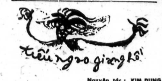
Nguyên tác: KIM DUNG Dịch thơ: THUY NGÂN

Tuà soạn và Trj sự: QUỐ GIANG - Saigon Mười chín đô tiên quán L. CAO ĐẮC TÍN