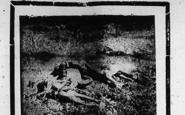
Trưng thân sát một trăm người thường dân ở Đắc Dakson