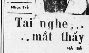
Tai nghe... mắt thấy