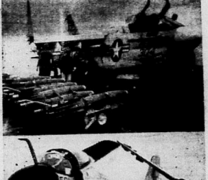
Chưa có thông điệp về Đại Hông vĩ HẬU BỊ QUẢN Sang Việt Nam