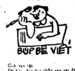
BÚP BÊ VIỆT

56 842 KHU VƯỜN BÚP BÊ VIỆT NAM DUYỄN ANH chăm non.