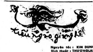
Nguyễn tác: KIM DUNG Đồ thuật: THƯƠNG LÂN

Tòa soạn và Trại 106 Giaclong - Saigon Ngân Phiên xin để tên ông Quân Lý CAO ĐẮC TÍN