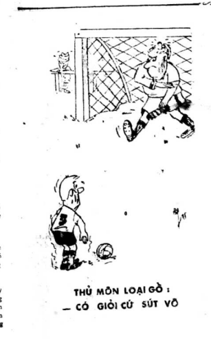
THÙ MÔN LOẠI GỒ : - CÓ GIỚI CỬ SỬ VỒ

"Tôi vậy, có dự và thế học chương trình... nói chuyện với Tuyệt một lát rồi "Chào".