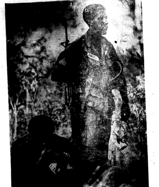
Chỉnh quyền dân c, Quốc Hội dân c, nhà dân VN