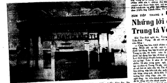
Tên gọi và Trị số 106, Cis-Long - Saigon