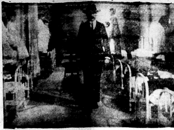
Đạo diễn: JEAN VIGO