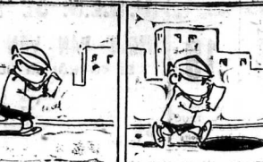
anh em chương còm