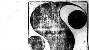
S. A. NG. T. A. C.