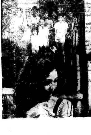
F.1. Hinh chụp đoàn Văn nghệ trước của Hotel Nha Trang.