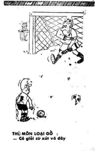
THÙ MỘT LOẠI GỖ : — Có giới cứu xút vô dấy