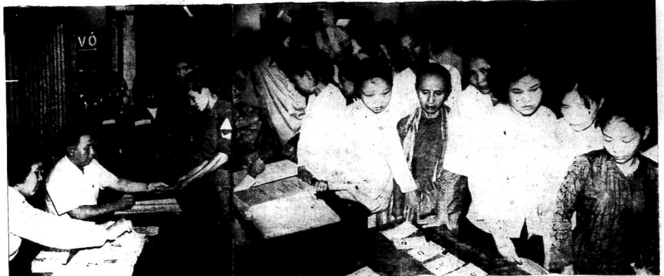
Tại 1 địa điểm bỏ phiếu khác các quân nhân sự đã đi bỏ phiếu trong họ đồ trận, được biết toàn thể quân đội đã đặt trong tình trạng ứng chiến 100% để chuẩn bị giờ an ninh cho ngày bầu cử — Hình trên là cảnh, các bà đi bỏ phiếu tự tay, chọn lần chót xui vì ai này, đều muốn làm bản phần công dân thật.

Tại một liên danh ứng thương... người ta cãi nhau như mổ bò và người ta bị đi 5 tờ bằng. Phải viên của nhà báo Sông đã lên ghi âm được cái sự cãi nhau như sau: — Mệ tiếp đưa con mụ 'bản chỉ' ấy vào liên danh hời chi chẳng xui. — Báo anh đóng tiền anh trư cái thân củ anh ra, giờ anh lại đi... — Tôi sướng lắm, sướng lắm Phải viên Thi Sĩ Anh Quan gặp từ sự liên danh chúng đồng đội diện thuộc La Thanh đường Tự Do. Bên về lấy, phỏng vấn... — Thưa... Anh nói lướt làm trong của 'mệ' thì hay tin đặng số số thương viện... — Tôi rêu rêu, rêu rêu, rêu rêu... — 'Mệ' sẽ đi một đường gì kêu tên cho đời? — Tôi sẽ chửi các những thằng đần... sau lưng quần hời ta. — Tuy nào đó, thưa 'mệ'... — Tuy chế đó bán thuốc Tây cho Việt Cộng. Quần thốn nạn, củ lý, đặng điểm, ăn quýt, ép phe với quan thuế không chịu, các chúng nó, tôi thấy âm ức khó chịu vô cùng.