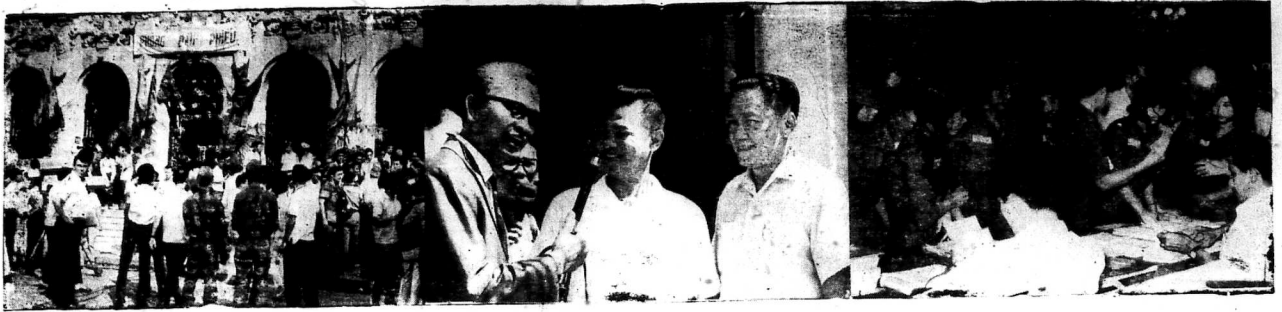
HÌNH TRÊN TỪ TRÁI QUA. — Hàng trăm ký gô trong và ngoài nước — Các hàng võ tuyến truyền hình V.N ngoại quốc tức trực từ 7 giờ sáng đã quan sát cuộc bầu cử hàng ké bên là nhạc sĩ Phạm Duy — Phó giám đốc Truyền Hình V.N đang phỏng vấn 2 cử tri cũng là 2 ứng viên thượng nghị viện — Trung tướng Đính và Trung tướng Đôn khi 2 ông, này tới bỏ phiếu tại Tòa Đô Chính — Các NĐ quân nhân cũng trong sắc phục ứng chiến đã đi bầu trong vắng trệt tại trụ sở Tòa Đô Chính Saigon.