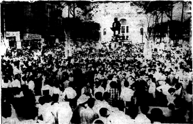
Cuộc bỏ phiếu thật sôi nổi tại Thủ Đô vì trước đó 2 ngày các ứng cử viên đã tích cực vận động bằng các buổi nói chuyện trước đồng bào. Hình trên 1 cảnh nói chuyện năm trong khuôn khổ cuộc vận động đang diễn ra trước Tòa Đô Chính Saigon.

Hà tuần tháng 9, bản tuần báo Con Ong đặt dưới quyền cố vấn tối cao của Khu Trín Ấc sẽ ra mắt bạn đọc. Thượng Sinh lùn chữ bất Con Ong, Con Ong là cơ quan ngôn luận của đảng Hết Long Cao Chi, Con Ong sẽ chính bằng thích chân bằng hời đời chết vật sáo ba của dân tộc ta, Bạn đọc như đơn con Con Ong. — Tinh bá con làng nước hay — Ốc ốc ốc... — Ốc ốc ốc... — Ốc ốc ốc... MỔ BÁO