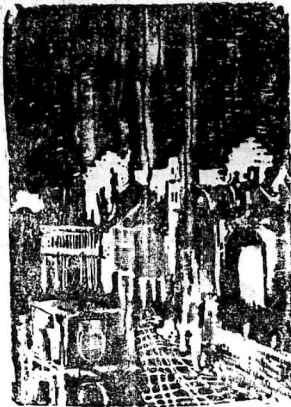
TỰ KỂ TƯƠNG