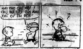
anh em chương cười