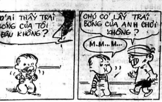
anh em chương cười