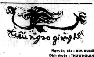
Truyện gia đình Nguyên tác: KIM DUNG Dịch thuật: THUẬN LAN

In tại nhà in riêng SONG 106 Giolong - 5g Ngày Phát hành và ấn hành: Thứ Hai 21-9-67