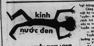
Truyện dài NGUYỄN-THUY-LONG