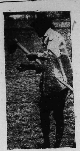
Tân Lợi, Bon Sa, Lành, Bô, những cái tên bé nhỏ sẽ đem hy vọng đến cho chúng ta.