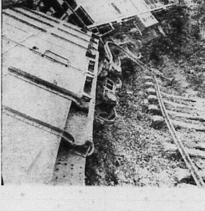
LẦN ĐẦU TIÊN TRÊN CHIẾN TRƯỜNG VIỆT-NAM

SAIGON 19.5. (Tin báo) Mặt phía quân của Hoa Kỳ làm cho các binh sĩ Hoa Kỳ làm cho các binh sĩ Hoa Kỳ làm cho các binh sĩ Hoa Kỳ làm cho các binh sĩ Hoa Kỳ làm cho các binh sĩ Hoa