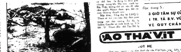
Chỉ một số nhà lãnh đạo của phe cộng sản Việt Nam, những người đang ở lại thủ đô của họ, sau khi họ đã rời khỏi vùng kiểm soát của họ.