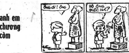
anh em chường còm Tranh LUẬN