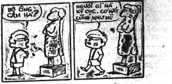
CHIM KHUYẾN NGẠI HỒT B. B. ANH CH