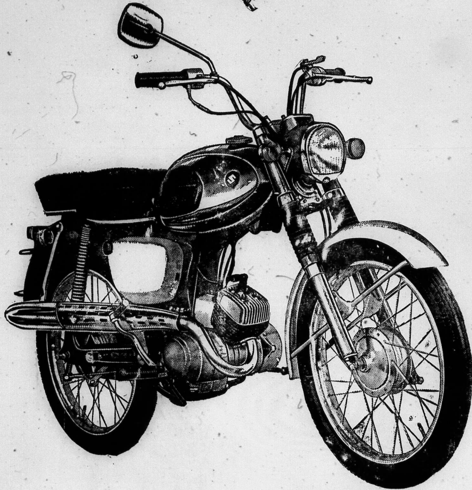
SUZUKI SPORT 50 Kiểu M. 12

Quý vị sẽ thích thú nét thể thao của xe này và sự ít hao sáng của nó.