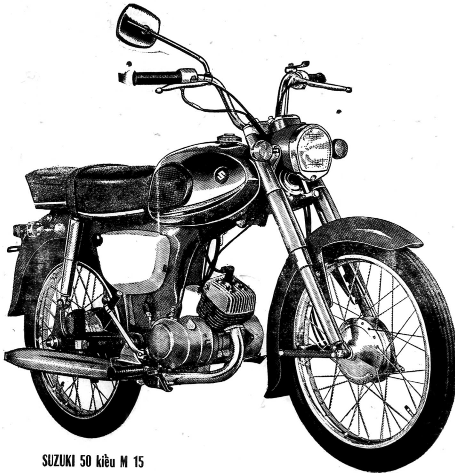
SUZUKI 50 kiểu M 15