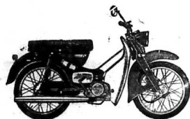
SUZUKI 50 KIỂU M 30

Quý ông và quý bà đều dùng được kiểu xe rất xinh đẹp này, ít hao xăng không thề tưởng tượng được, chỉ có 1 lít mà chạy đến 95 cs.