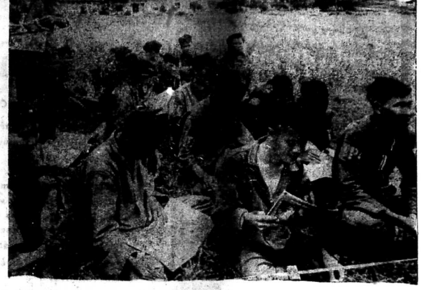
Sau những trận đụng độ liên tục, VC thường cho báo chí viết là những thành tích ở BV được Hà Nội...