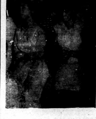
Hình ảnh đẹp đẽ của ngày xuân... Hình ảnh đẹp đẽ của ngày xuân, thật tươi sáng...