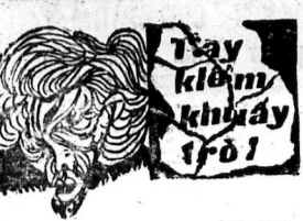
Người tác KIM-DUNG