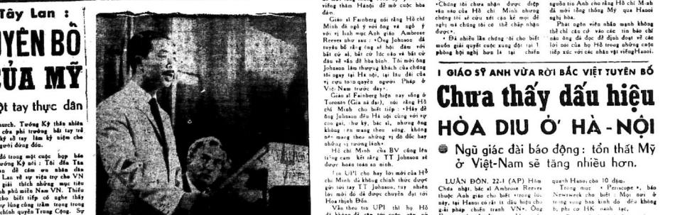
Tên: Thủ tướng Nguyễn Văn Xuân (trên cùng) đang đi thăm đơn vị tại vùng chiến sự ở miền Bắc.