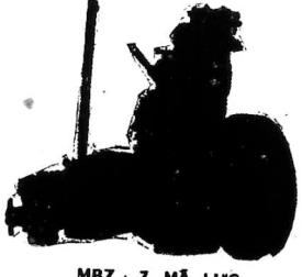
MBZ : 7 MÃ - LỰC