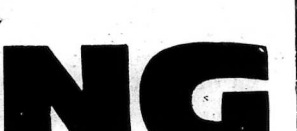
Chủ nhiệm kiêm Chủ bút: CHU T. T. CHU V. AN B. H. N. H.