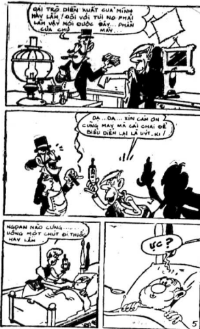
NGHĨA NÀO LƯƠNG... HỒNG MỘT CHỨNG CHỨNG HANG MÀ...