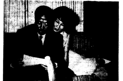
Phu nhân của Tướng Kỳ đang gặp gỡ các đồng chí tại bãi diễu văn phòng riêng trước khi rời đại sứ quán đường phố cuộc họp báo tại Honolulu

SAIGON 23.2.— Báo "Đài tiếng Saigôn" đã đưa tin về việc giải phóng thuộc họ kuy Saigon - Gia-dinh.