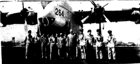
Hội 11 giờ sáng 14-2-66 tại Thủ Đức. Ông Nguyễn Văn Thiệu đang nói chuyện với các tướng lĩnh.

Hán Thành (3-2) (UPI). Theo tin của báo này, 4000 đống bị vấy, bắt tại Hán Thành