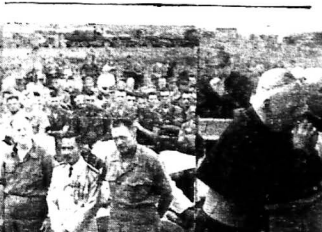
Sau khi kết thúc cuộc chiến tranh, gia đình của một người lính đã trở về quê hương.