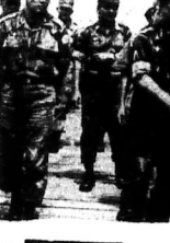
Trung Tướng chủ tịch ĐBĐQG đã thay đổi một số thành viên Hội đồng Chính phủ.

Chiến tranh Việt Nam đang tiếp diễn với những diễn biến phức tạp. Người dân miền Bắc đang mong chờ một ngày hòa bình để được sống trong yên bình. Họ mong chờ một ngày hòa bình để được sống trong yên bình.