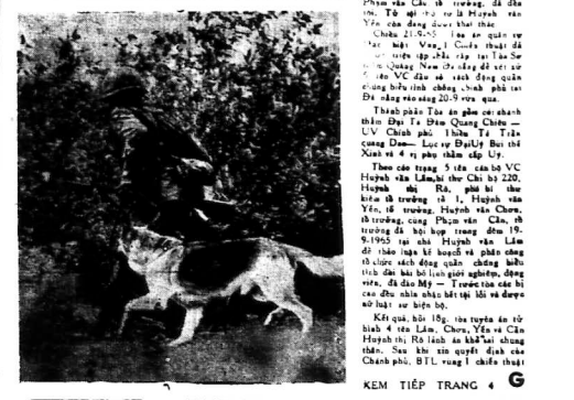
KEM TIẾP TRANG 4