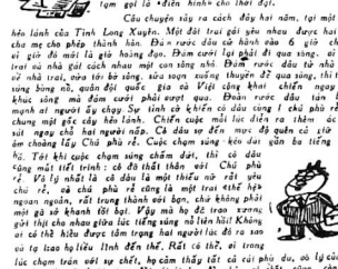
Hiện đầu tiên cho Cao Nguyên, là tiếp đôn 37 đơn vị sinh viên sĩ quan Trường quân sự Cao Nguyên...