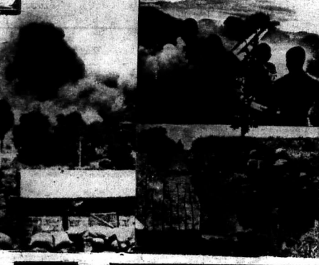
Đức Cỏ dưới bom đạn và lửa bóng...

ĐỨC CỎ ĐƯÔI BOM ĐẠN VÀ LỬA BÓNG... XEM TIẾP TRANG 4 B