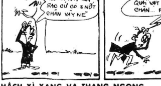
HÀNH XÍ XANG VÀ THANG NGỌNG

Địch Việt Cộng đã thảm bại khi cố dùng một trận đồng-koaxi thử hai... (Tiếp theo)