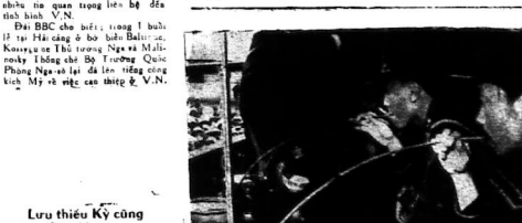
SAIGON 26-7.—Các đại phái thành ngoại quốc tới đây để làm việc về hòa bình...