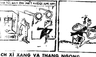
HỒI NHƯ BAO TRU CHIA