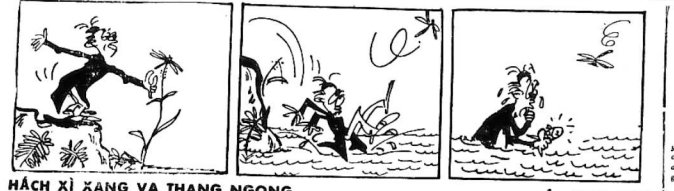
HẠCH XÍ XANG VÀ THANG NGỌNG của ANH-GIAO

CHỮ THỊCH - Annotement: song sát. Parse: vi say. Dig up: đào, y nói Tuấn không cần phải chạy trốn để tìm tiền nữa. Growled: rên. Thief: ăn cắp. Gamble: đánh bạc. No use staying here: đừng chằng ở lại đây. Cat that spouts a mouse: mèo vờn chuột (chữ Pháp và chữ Anh) không có chủ này mà địa dịch giả sửa: sửa để cho hợp với văn chương Anh (Pháp). Stuffed: nhét đầy.