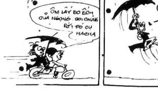
CHÚ THÍCH: — Fell like a bomb, nổ sướng như một trái bom. Khái nghe Diêm nói chuyện đay đay Diêm cũng như tiếng sét nổ bên tai.