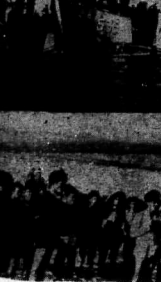
Hình ảnh cuộc hành quân Tiền Giang 10-85 khai diễn tại một khu Thanh Phong quận Bả

Được biết thuyết trình của Đại tá Đàng Sĩ Nguyên... XEM TIẾP TRANG 4