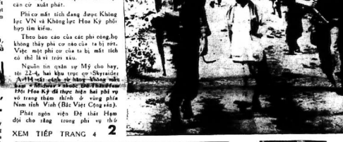
Đội quân của Thủ tướng đang hành quân qua vùng quê...