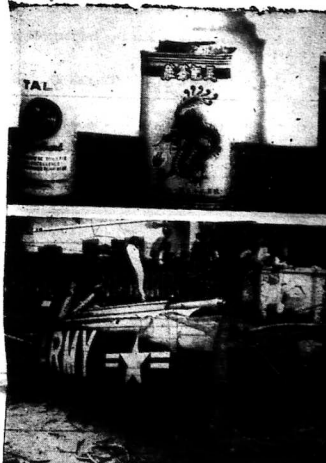
HÌNH 1: Một chiếc xe tăng của VC đang tiến về phía Bắc Đà Nẵng.