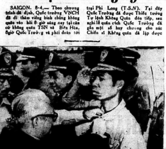
SAIGON. 4-4. - Theo chương trình diễu hành, Quốc trưởng VNCH đi đi thăm vùng bình định bằng máy bay... (Caption continues with details of the flight and the President's presence.)

Hôm Thứ Bảy (4-4-1965) VỮA OUA TẠI SAIGON T.T. Kỳ còn tiết lộ : « CHÍNH HỒM ĐÓ T.Đ. RA LỆNH CHO NHIỀU MÁY BAY THAY PHIÊN TUẦN TIỆU KHÔNG PHẬN SAIGON » « Sẽ dội bom ngay vào đầu bọn đảo chánh »