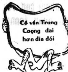
Cả Trung Công đả hạ địa đót