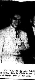
Hồi 10 giờ 30 thì ngày 1-3-65 Thủ tướng Linh quang Việt Nam và Ngoại trưởng Diệm...