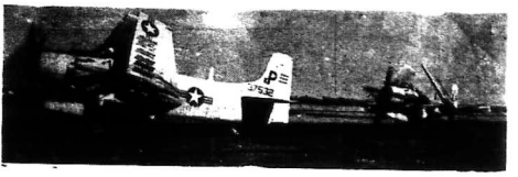
Các oanh tạc cơ AD-6 Skyraider của không lực VNCH trở về căn cứ sau khi oanh tạc Quảng Khê

* Địa điểm oanh tạc của không quân Việt-Nam là căn cứ Hải quân Quảng-Khê * ĐỊA ĐIỂM OANH TẠC CỦA 140 PHÂN LỰC CƠ MỸ LÀ CÁN QUÂN SỰ Ở XOM BAN * Tàu chiến VC dự trận, 3 phi cơ của ta bị trúng đạn nhưng các phi công đều được cứu thoát.