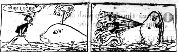
HÁCH-XI-XANG VÀ THANG NGỌNG của ANH GIU

CHƯƠNG I Trong đình Tể Tướng Tất cả tôi cũng cảm thấy... (Còn nữa)