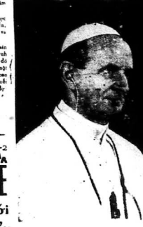
Đức Giáo Hoàng Phao Lô Đệ Lục