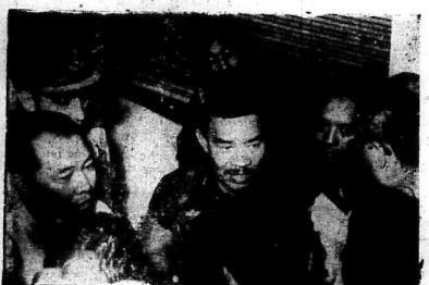
Đức Giáo Hoàng Phao Lô Đệ Lục

Việt Nam: Tình thế mới... XEM TIẾP 9 TRANG 4