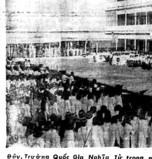
Đầy, Trường Quốc Gia Nghĩa Tử trong ngày Lễ khai giảng

SAIGON. - Bộ Cựu Chiến Binh hôm 2-8 cho biết sẽ mở thêm lớp ĐỀ THẬT có 200 học sinh Quốc Gia Nghĩa Tử tu. Huô.