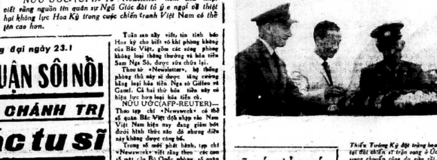
Thiếu Tướng Kỳ đã từng học tại Mỹ và trở về nước để tham gia vào quân đội của VC.

SAIGON. - Một căn nhà có 6 căn hộ và một biệt thự đã bị cháy rụi. Ba người bị thương trong vụ cháy. Nguyên nhân của vụ cháy vẫn chưa được xác định.