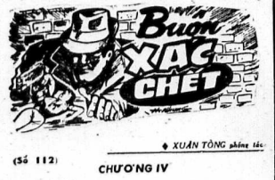
BUỒN XÁC CHẾT. Khắc họa của họa sĩ PHƯƠNG TÌNH NHÂN.

— Ông Khưu rõ anh chàng này... — Phải là ai đó... Ông Khưu nói: